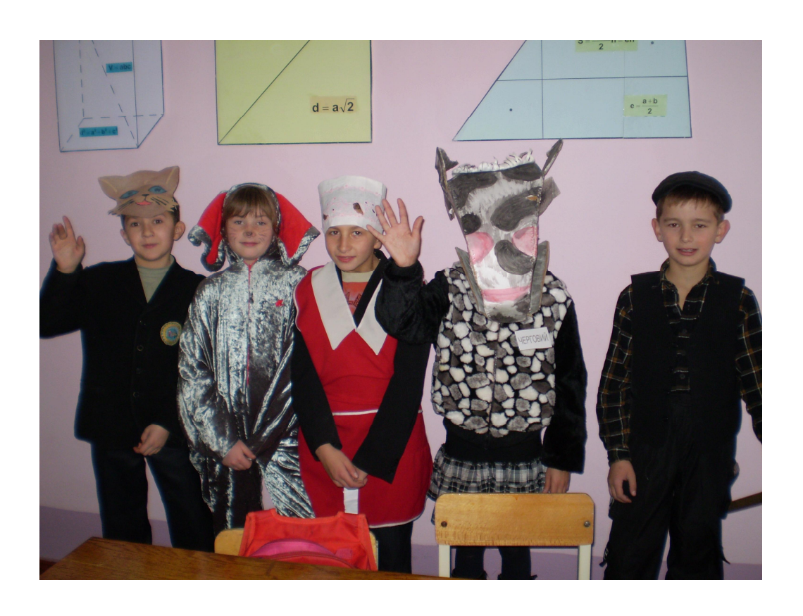
м. Новоград – Волинський 2013